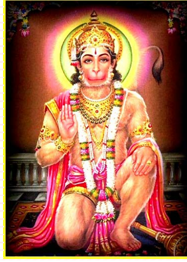
మంగళ మూరుతి స్తుతి

మంగల మూరుతి మారుతి నందన్, సకల అమంగళ్ మూల్ నికందన్ పవన్ తనయ్ సంతన్ హిత్కారి, హృదయ విరాజత్ అవధ్ బిహారి. మాత్ పితా గురు గణపతి శారద్, శివా సమేత్ శంభు శుక్ నారద్ చరణ్ కమల్ బంధవు సబ్ కాహు, దేహు రామపద్ సేహు నిబాహు. జై జై జై హనుమాన్ గోసాయి, కృపా కరో గురు దేవ్ కి నాఈ బందువు రామ్ లఖన్ బైదేహి, యహ్ తులసీ కే పరమ్ ససేహి